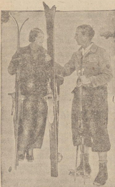
KROLEWSKA PARA NARCZARZY.

W miejscowości węgierskiej Szentes, gdzie prowadzone są od dłuższego czasu badania archeologiczne w poszukiwaniu grobu Attyli, znaleziono istotnie wykopaliska z różnych okresów historycznych. Dość odkopanych grobów sięga kilku setek. Znaleziono w grobowcach przedmioty są bardzo cennymi dokumentami kultury i cywilizacji z okresu panowania w tych okolicach Rzymian, Hunów, Gepidów. Prócz licznych okazów monet z czasów cesarza Marka Aureliusza, odkopano naszyjnik z pereł, rozmaite drobne przedmioty służące do celów kosmetycznych. Nad brzegiem Cisy odkopano szereg grobów rzymskich, w których odmalowano zachowane dobrze szkielety koni, części metalowe uprzęży, zbroje, miecze i t. d. Wiek odmalowanych przedmiotów oceniają archeolodzy na 1500 lat.