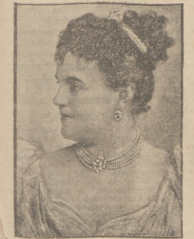
ZGON ŚLAWNEJ ARTYSTKI.

Bo nędy coraz więcej. Oto kilkadziesiąt rodzin, których żywiciela była do niedawna mała kopalenka „Baška”, kończy swój anemiczny żywot; u progów staje głód i chłód z-