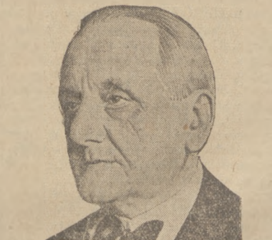
MIN. KANYA W GENEWIE. Węgierski minister spraw zagr. Kanya, który udał się do Genewy, aby Lidze Narodów przedłożyć wynik dochodzenia, w sprawie emigracji chronionych na Węgrzech.

Skądżeż my do tego dochodzimy, by o Polsce opowiadano w świecie najbardziej nieprawdopodobne dziwactwa, z oddaniem Pomorza włącznie, w co u nas nikt wogóle nie może wierzyc?