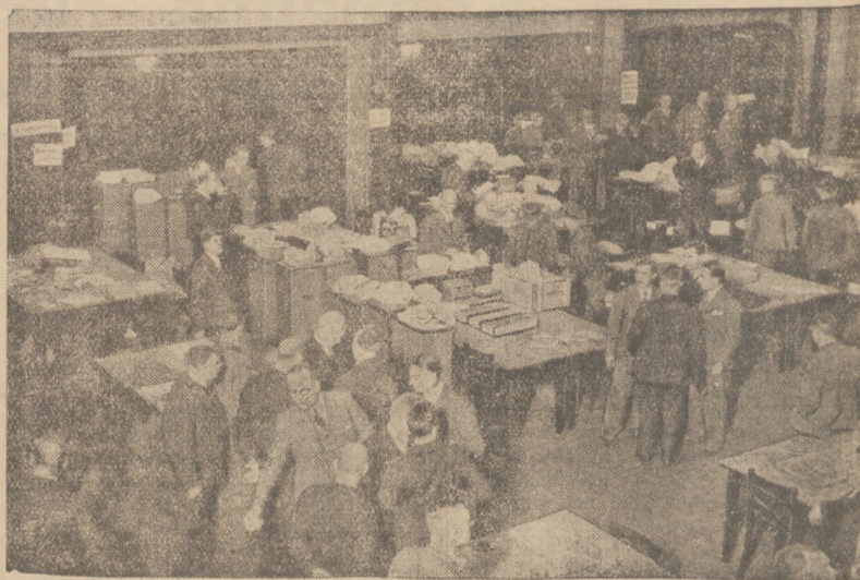
W domu „Wartburg“ w Saarbrücken odbywa się, przy poszczególnych stołkach, liczenie głosów z całego terenu plebiscytowego.