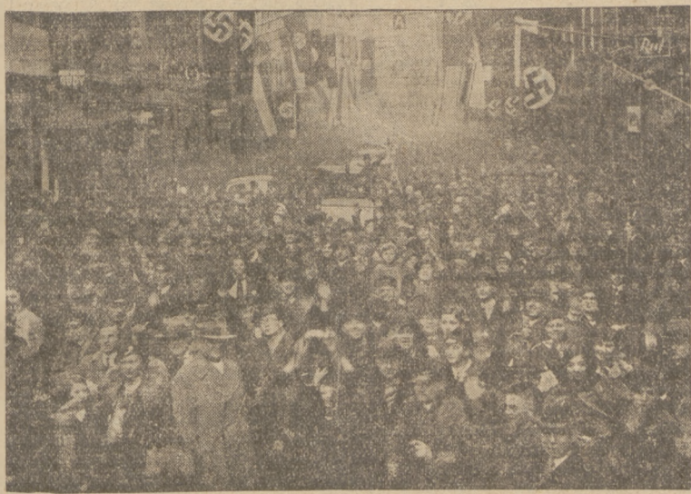
Entuzjazm tłumów na ulicach Sarajewo po ogłoszeniu wyników plebiscytu.

Łachmany te jednak przydarły się już Stalinowi kilkakrotnie. Do razy coś jest nie w porządku z nastojami opinji partyjnej a rząd pragnie odwrócić od siebie uwagę w stronę „kontrewolucjonistów“, zawsze wyciąga się za uszy tych obu skrachowanych działaczy bolszewickich. Po raz ostatni było tak w roku 1932, gdy okazały się poważne niedociągnięcia piątowej piatiletki: wtedy oskarżono Zinowiewa i Kamieniewa wraz z 20 innymi starymi działaczami partyjnymi, że... oni to wszyscyemu winni, bo dążyli do odbudowy inkapitulizmu. Obecnie historia powtarza się — tym razem chyba już po raz ostatni, jeśli na Kremlu uznano, że najkorzystniejszą dla trwałości regimenu będzie, gdy obaj „spiskowcy“ oddadzą głowy.