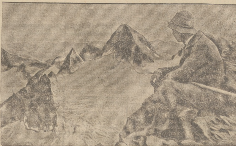
WYPOCZYNEK WŚRÓD GÓR.

Wyloczka na Turbacz prowadzona przez przewodników Polskiego Związku narciarskiego, punktowana jest dla Odzimki górskiej P.Z.N. Pociąg niedzielny jest pierwszym z serii pociągów popularnych, urządzonych pod hasłem zdobywania Odzimki górskiej. Dla uczestników a poza Krakowa istnieje dogodnie możliwość dojazdów do pociągu i spowrotu.