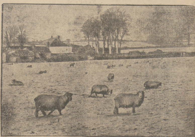
ANGLIA POD ŚNIEGIEM.

Sensacyjny wynalazek antyji japońskiej pozwala dostrzegać zdjęcia fotograficzne z odległości 250 kilometrów.