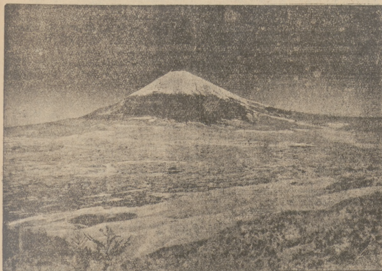
WULKAN FUJIJAMA Z ODLEGŁOŚCI 250 KLM.

Sensacyjny wynalazek antyji japońskiej pozwala dostrzegać zdjęcia fotograficzne z odległości 250 kilometrów.