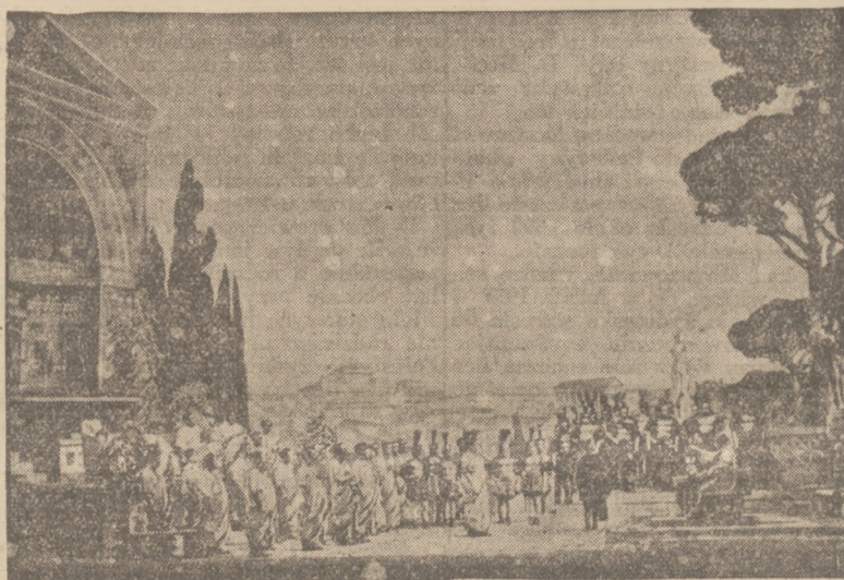
NOWA OPERA MASCAGNIEGO.

Do zwalczania gorączki nadają się zupełnie, dzięki swemu składowi chemicznemu, tabletki Tegal, będące zarazem środkiem przeciwbólowym, przeciwwreumatycznym i przeciwanalgicznym. Tegal jest dobrym środkiem przeciwgorączkowym.