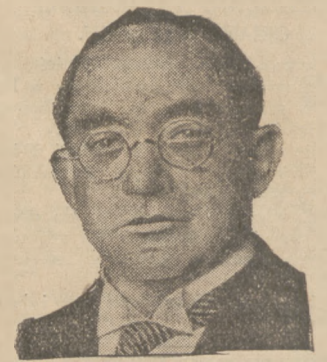
SPRAWA ZWROTU KOLONIJ NIEMIECKICH Sprawa zwrotu Niemcom kolonii zamorskich znów zaczyna zajmować opinie publiczne. Minister obrony Unji poludniowo-afrykańskiej, Oswald Pinow, (na zdjęciu), wygłosił mowę, w której wyznał życzenie, aby Niemcy znów stanęły w rzędzie państw kolonialnych.

Egipski premjer podarował pierścienia Muzeum Starożytności w Egipcie.