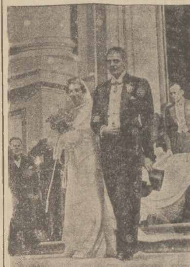
ŚLUB W RODZINIE BURBONÓW.

— TABLICA CHOPINA W DREZNIE. Jak wiadomo Chopin przebywał parokrotnie w Dreźnie. Na domu przy placu Neumarkt, gdzie mieszkał w r. 1835, będzie umieszczona tablica pamiątkowa, skomponowana przez rzeźbiarza dresdeńskiego, Radtkego. Odsłonięcie odbędzie się w lutym; połączone z nim będą u roczystości chopinowskie.