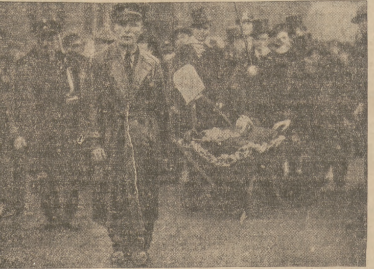
SYMBOLICZNY POGRZEB. W dniu plebiscytu urządzono w Saarbrücken alegoryczny pogrzeb „status quo”.

ZAKŁAD TAPICERSKI Piotr Tomczyk, Sosnowiec, Nowopogońska 19. Poleca otomany materace, tapczany, kozetki, fotele klubowe Roboty solidne. Ceny konkurencyjne. Warunki dogodne. 435