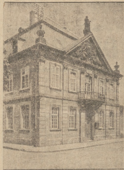
Z lewej strony ratusz w Bliokastel, z prawej ruiny kaplicy w Meßlach, najstarszy zabytek budowlany w Zagłębiu Saary.