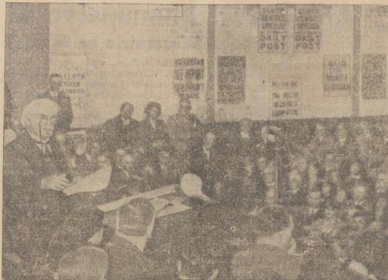
Lloyd George w 72 rocznicę urodzin wygłasza w Bangor wielką mowę polityczną, zapowiadając — w razie dojścia do władzy — radykalne reformy gospodarcze.

KINO „Zagłębie” dawnej Kino-Teatr „Udziałowy”