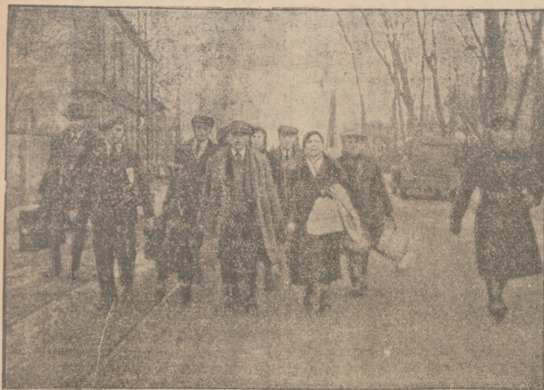
WYCHODZCY Z SAARY NA GRANICY FRANCUSKIEJ. Grupa wychodźców z Saary, wędrujących pieszo.