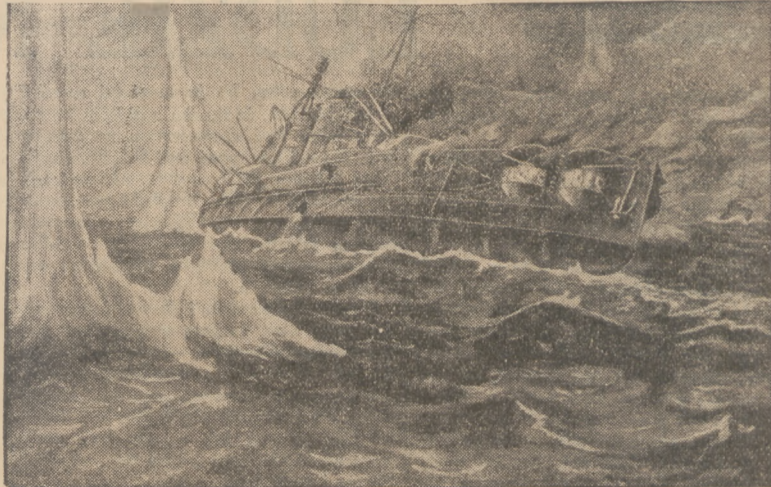
Obraz przedstawiający otulinie chwile niemieckiego pancernika „Blücher” podczas wielkiej bitwy morskiej 24 stycznia 1915 roku pod Doggerbank, gdzie Anglicy odnieśli ważną zwycięstwo.