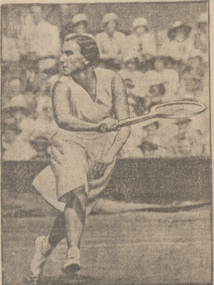
Mistrzem Australji w tenisie został Jack Cra wford, z kobiet mistrzyni Wimbledonu i Dorota Round.