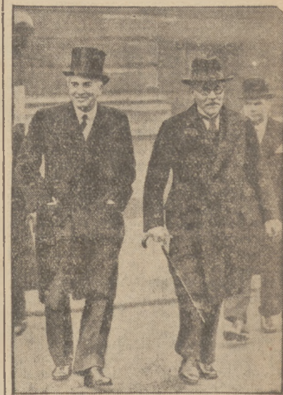
Mac Donald i min. spraw zagran. Simon udają się na otwarcie parlamentu angielskiego.

Na takim podłożu wystają rzeczy, o których była mowa poprzednio. Nie można wobec nich przejść nie zwróciwszy na nie uwagi.