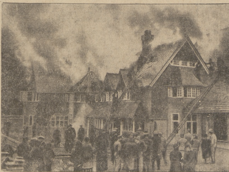
POŻAR NISZCZY UNIwersYTET.

BUKARESZT, 31.1. (PAT). Panują tu mrozy i epidemia grypy. Wskutek choroby szkoły zostały zamknięte. Prawie wszyscy członkowie rządu zapadli na gripę i 5 z nich z premierem Tatarescu jest obłożnie chorych. Wszystkie narady rządu zostały odłożone.