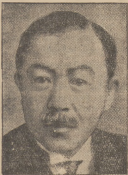
NAGAOKA, nowy przedstawiciel Japonji w Międzynarodowym Trybunale w Hadze. Nagaoka posłem japońskim w Paryżu.

Uchwalono również projekt noweli do ustawy o wypuszczeniu biletów skarbowych. Nowela przewiduje podwyższenie granicy obrotu biletów na 300 milj. zł., podnosiąc temsamem poprzednio ustaloną granicę o 100 milionów zł. Nowela przewiduje również skrócenie rocznego limitu termínu ważności biletów skarbowych.