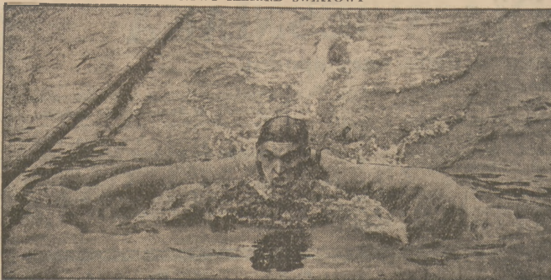
w pływaniu stylem klasycznym na przestrzeni 200 m. ustalił Niemiec Siegas czasem 2:42,4