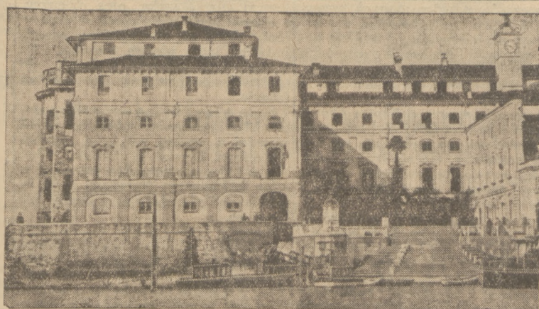
PRZED KONFERENCJĄ TRZECĄ. 14 kwietnia rozpoczęła się w Silesie, na zameku Bismarck (na ilustracji) konferencja Mussoliniego i ministrów spraw zagranicznych Francji oraz Anglii.