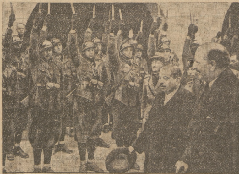
OSTATNIE ZDJĘCIE Z KONFERENCJI W STRESIE.

Francisco premier Flendin i minister spraw zagranicznych Laval zwiedzają malowniczą wyspę Rybaków na Lago Maggiore. Oddział wojsk włoskich wita ministrów radzących nad zapewnieniem światu pokoju, prezentując... sztylety.