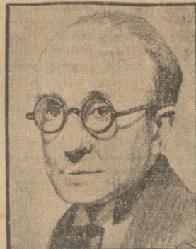
SALVADOR DE MADARIAGA

Dla „Kurjera Porannego“ religia stała się fikcją. Nasi rodzimi masoni szybko jąda.