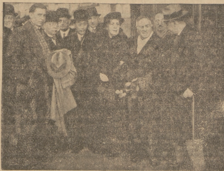
SVEN HEDIN W DRODZE DO OJCZYZNY.