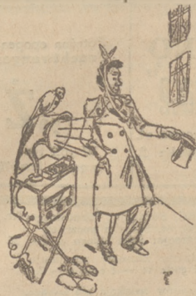
Kostaryniarz, w epoce radja.