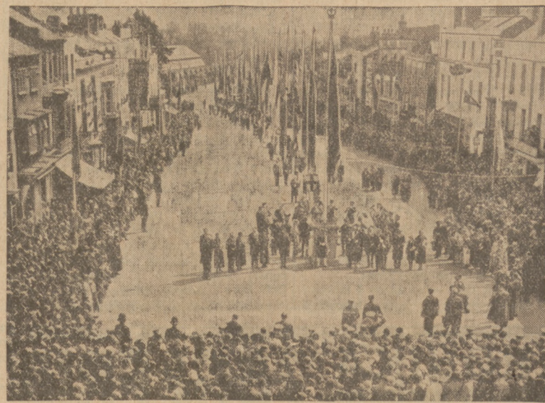
FESTIVAL SZEKSPIROWSKI W STRATFORD

Fakty te budzić muszą poważne za-niepokojenie.