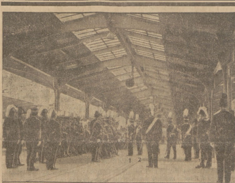
SPOTKANIE ŻÓŁTYCH CESARZY.

PARYŻ, 26.4. (PAT). Havas donosi: W tutejszych kołach greckich oświadczają, że b. król Jerzy powróci do Grecji tylko w tym wypadku, gdyby parlament grecki, który zbierze się 15 maja, uznał się za konsytywantę i wezwał go do powrotu do kraju.