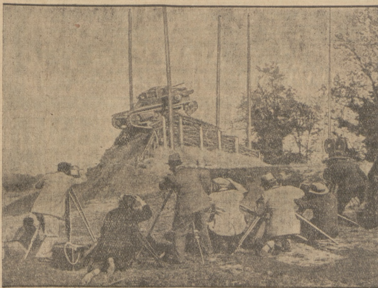
ZAWODY SPRAWNOŚCI CZŁOGÓW WE WŁOSZACH.