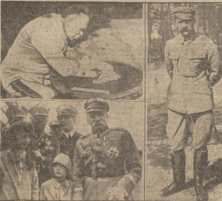
Z ŻYCIA MARSZAŁKA PIŁSUDSKIEGO.

Trumna ze zwłokami Marszałka Piłsudskiego spocznie wśród grobów królewskich w krypcie króla Jana Sobieskiego, w tym miejscu, gdzie Marszałek składał raport królom o wskrzeszeniu Polaki.