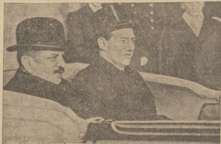
Z POBYTU MINISTRA LAVALA W WARSZAWIE. Ministrowie Laval i Beck w saonachodzie.