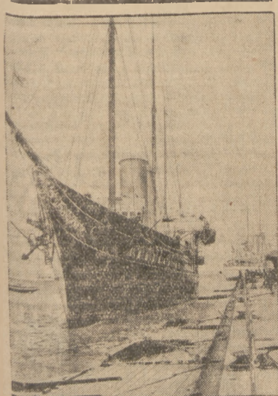
PRZED PARADĄ FLOTY ANGIELSKIEJ.

Stał w Wielkiej Brytanii, jak najlepiej potrafił, i z tego był dumny.