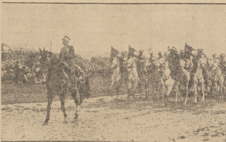
OSTATNIA DEFILADA NA POLU MOKOTOWSKIM

Uzdolnieni do sterowania, nawa państwa, niż ich przodkowie, ale określony zakres działania państwa, stał się mniej podatny do sterowania. Ludzie wszędzie i zawsze są mylni. Im większy zakres działania państwa, tem groźniejsze są skutki omyłek.