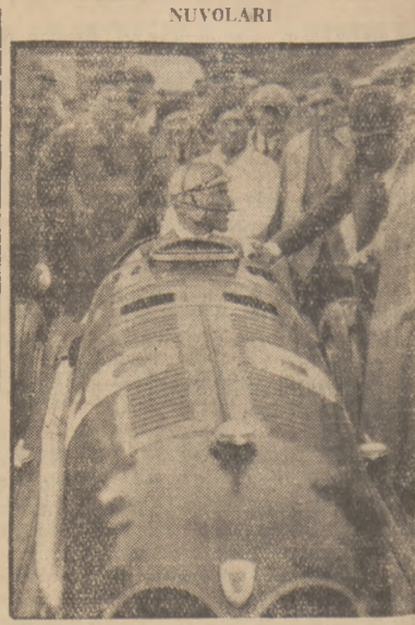
znany kierowca samochodowy na nowym wozie Alfa Romeo.

Dbajcie o swoje zdrowie! „Szwajcarskie Gorzkie Ziolo” z marką „Kogut” są stosowane przy chorobach żołądka, kwaszki, obstrakcji, kamieniach żółciowych. — „Szwajcarskie Gorzkie Ziolo” są naturalnym łagodnym środkiem przeczyszczającym, ułatwiającym funkcje organów trawienia, działającym przeciwko otyłości. Sprzedają apteki i sklepy apteczne.