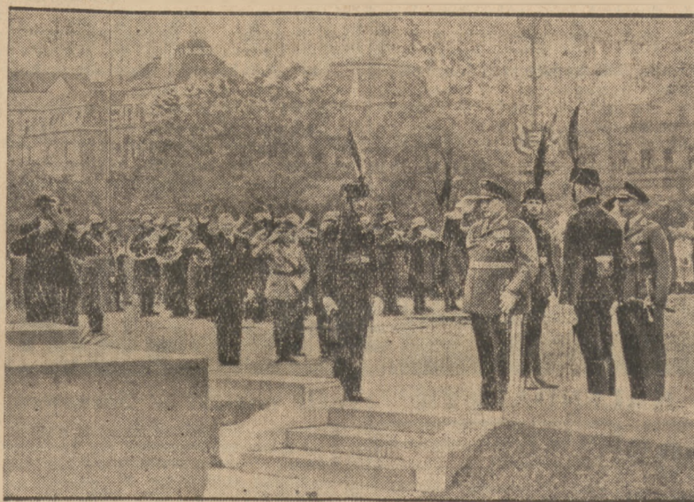
GOERING W BUDAPESZCIE

Gospodyni jest dumna ze swej świeżo wypranej bielizny, która odznacza się wyjątkową białością. Użyła do prania czystego, rdzennego mydła, które usuwa wszelki brud, a jednocześnie zapobiega żółknięciu bielizny.