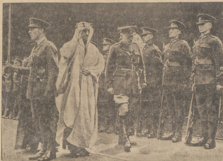
EGZOTYCZNA WIZYTA W ANGLJI.

Emir Saud, następca tronu Arabii, bawi w Londynie jako gość rządu angielskiego. Na ilustracji powitanie emira w porcie Dover.