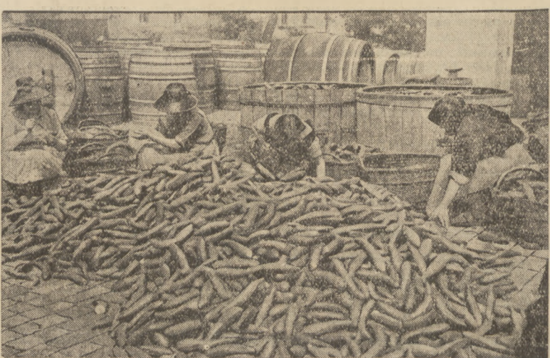
OGÓRKI! Kwaskne ogórki! Ogórki na ilustracji nie są wprawdzie jeszcze kwaśne ale przygotowuje się je do kiszenia.

Wypadek ten wywołał w całej okolicy wielkie wrażenie.