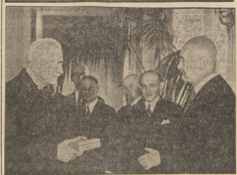
ODZNACZENIA DLA TWÓRCÓW KONSTITUCJI.

Naogół więc, horoskopy na wielkie zainteresowanie ogółu nowymi wyborami, nie są, jak dotąd, zbyt wyrażne.