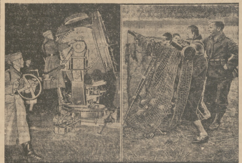
NIEMIECKIE MANEWRY NAD BAŁTYKIEM