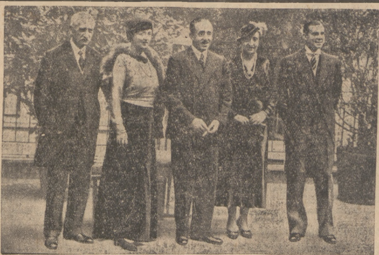
ŚLUB W HISPANSKIEJ RODZINIE KRÓLEWSKIEJ

Dlatego też ważne jest nie tylko powołanie nowego rządu, co rozpoczęła ewolucja polityczna naszego państwa”.