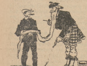
— Skąd wzięłaś taką długą brodę? Szkot: Przed dziesięcioma laty opuścili mnie bracia i zabrał brzytwę...