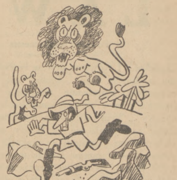
— To śmieszne, że wybrałem się do Afryki, aby pozbyć się kłopotów... —