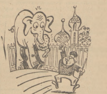
— Psiakrów! Po co ja ten węzeł zrobiłem!