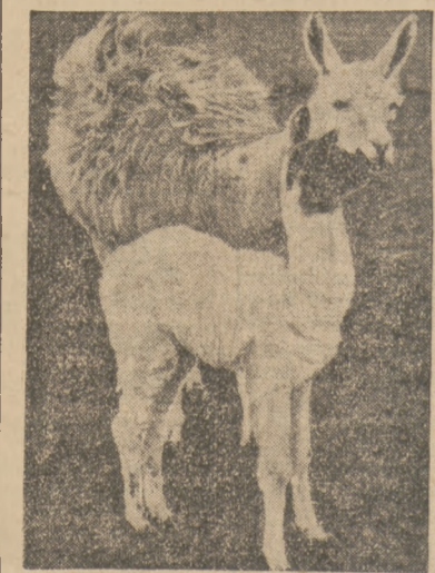
LAMA Z „LAMIATKIEM“ przeżywają chwilę szczęścia w ogrodzie zoologicznym.