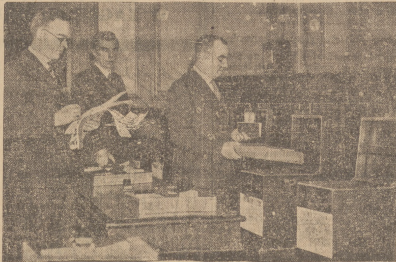
WYBORY W ANGLI. Przygotowanie urn wyborczych w londyńskim ratuszu.