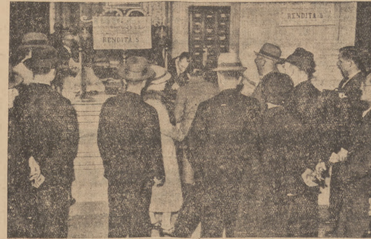
WŁOŚCI PODPISUJĄ POŻYCZKĘ WOJENNĄ.

Bez względu wszakże, czy te światowe plany udadzą się, czy nie, już dziś taktyka poszczególnych partji komunistycznych uzgodniona jest ściśle z taktyką sow. polityki zagranicznej.