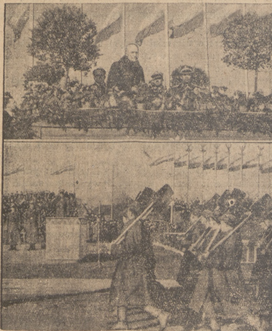
ECHA ŚWIĘTA NIE PODLEGIŁOŚCI.

Jednak skala ma być rozszerzona tak, że stawka 50% dotyczyć będzie uposażeń wynoszących 10.000 złotych miesięcznie. Jak słychać, podwyżka podatku dla grup, zarabiających do 500 złotych miesięcznie wyniesie ma około 50%, potem stopniowo będzie wzrastać tak, że na przykład przy uposażeniach 2.500 zł. miesięcznie podwyżka wyniesie już blisko 100%.