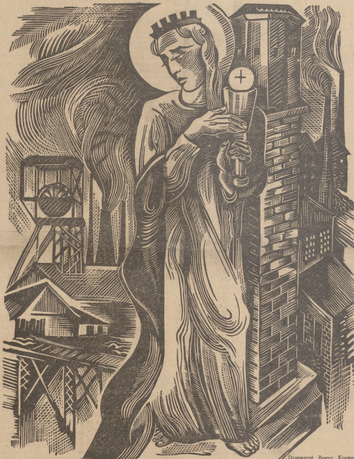
Drzeworyt Bogny Krasnodębskiej-Gardowskiej

Szybu ciemność złowroga wilgocią ocieka Lat milion jasność słońca na węgiel skamieniał A teraz płynie szybem czarna ludzka rzeka, By się kamień na światło i ciepło znów zmienił.