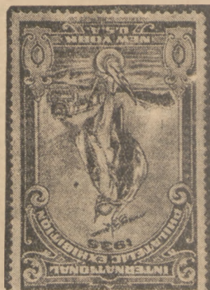
NOWE ZNACZKI AMERYKANSKIE. Wydane w związku międzynarodową wystawą znaczków pocztowych w Nowym Jorku, która odbędzie się w 1936 r.

Sąd przewiduje, że rozprawa potrwa cztery dni do 12 grudnia włącznie, bowiem prócz przesłuchania oskarżonych na trybunał do przesłuchania 40 świadków, zaważanych do rozprawy przez urząd prokuratorski. Dłuższy czas potrwać niewątpliwie przemówienia obrońców.