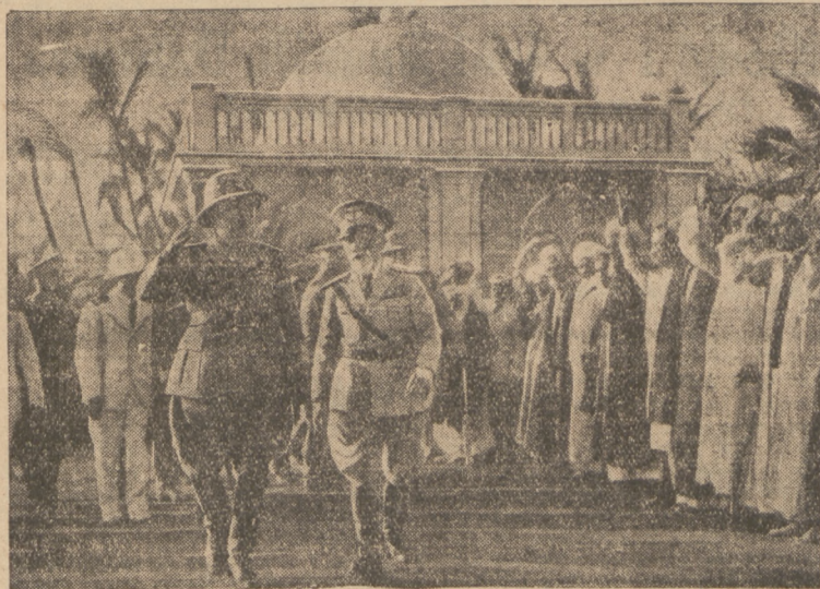
BADOGLIO OBEJMUJE DOWÓDZTWO. Marszałek Badoglio, nowy wódz naczelny wojsk włoskich w Afryce wschodniej po przybyciu do Marsaury, gdzie powitał go marszałek de Bono.

— Nie! Ci, których opinia określa mianem obozu pułkownikowskiego są w dalszym ciągu przekonani, że społeczeństwo nasze nie dorosło jeszcze do systemu demokratycznego - liberalnego. Ich zdaniem Polska przez długi czas jeszcze będzie potrzebowała twardej