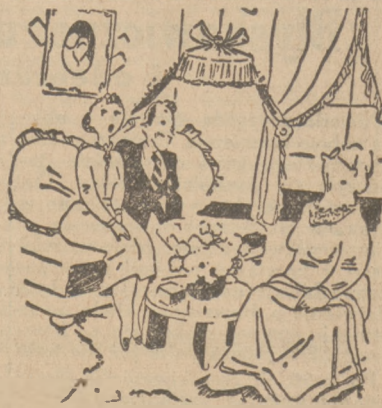
WŁOSKI HUMOR SANKCYJNY.