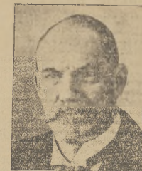
... SVENIYLLI... został wybrany większością i głosu.