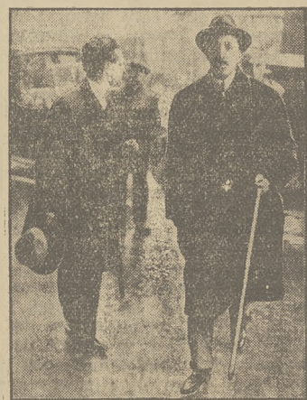
Ex-król Alfons po opuszczeniu Hiszpanji wstąpił w Marsylii na ziemię francuską.

U dorastającej młodzieży, stosuje się rano szklankę naturalnej wody gorzkiej „Franciszka-Józefa” i przy użyciu takowej, jej czyszczące działanie na krew i naprawa funkcji żołądka i kiszek u dziewcząt i chłopców, daje zjawiony skutek. Żądać w aptekach i drogeriach.