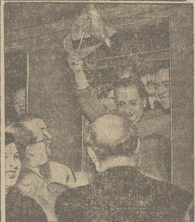
Major Franco, przewodca grudniowej rewolty w Hiszpanji, wraca z wygnania — z Paryża do ojczyzny.

„Wileński Bank Ziemi” wystawił na licytację z powodu niezapłaconych długów, ciężających na nieruchomościach w Wilnie, Nowogródku, Łucku, Równem, Białymstoku i Pińsku. Wykaz obejmuje 44 strony druku i obejmuje 435 nieruchomości miejskich oraz 1598 wiejskich.