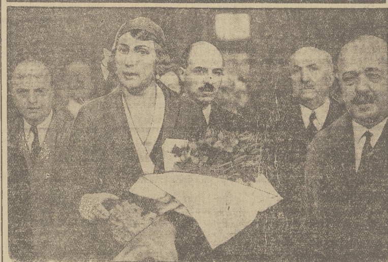
Przyjazd hiszpańskiej ex-królowej Eny do Paryża.