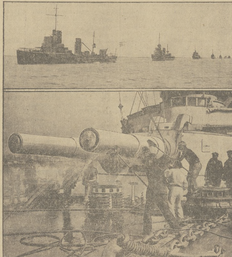
Z MANEWRÓW NIEMIECKIEJ FLOTY W SWINIÓUJSCIU.

Na kilka dni zwołania sesji sejm- ownie będzie więc mało doniosłe zna- czenie. Przedewszystkiem będzie to próba stanowiska większości sejm- owej wobec niemożności ciężkich war-unków, postawionych przez kapita- listów francuskich przy projektowa- nej koncesji na budowę i eksploata- cję kolei Gdynia-Sląsk. Taki czy inny stosunek Rządu i popierającej go większości do tej sprawy przesądzi na najbliższą przyszłość warunki, na jakich kapitał obcy będzie wpo- niaływać do Polski.