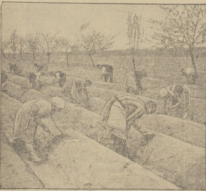
W ogrodach pod Poznaniem rozpoczęły się już pierwsze zbiory szparagów.