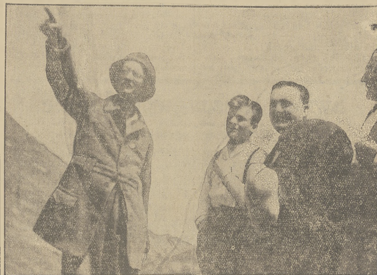
PROF. PICCARD wskazuje przedstawicielom prasy miejsce, w którym wyładował.