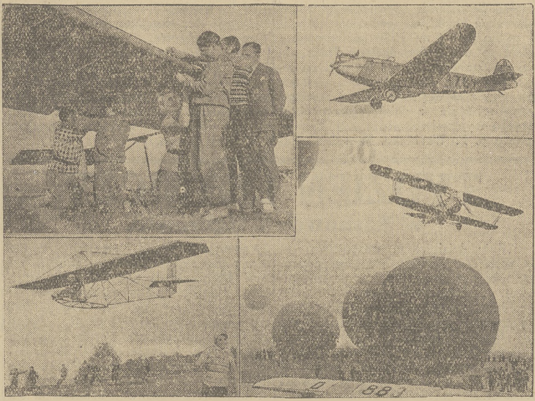
FRAGMENTW Z TYGODNIA LOTNICZEGO.