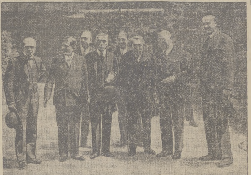
Od lewej strony: Piętni minister spraw budżetowych, premier Laval, amerykański sekretarz skarbu Mellon, min. Biand, amerykański ambasador w Paryżu Edger, francuski minister finansów Flandin. Mellon prowadzi w Paryżu rokowania w sprawie pożyczki Hoovera.

AMERYKAŃSKI PRZEDSTAWICIEL SKARBU NA ROKOWANIACH W PARYŻU.