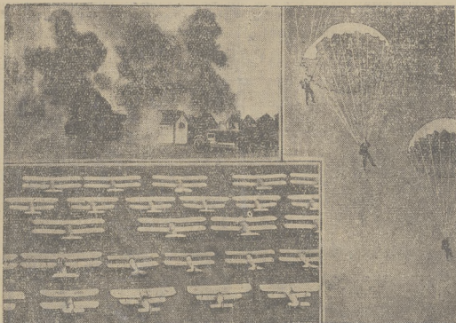
Podobnie jak corzeka odbyła się w Hendon pod Londynem wielka parada angielskiej floty powietrznej. I góry na lewo — zniszczenie się przez bomby zapalne. Niżej delidła aeroplanów. Na prawo — ćwiczenia spadaczków.