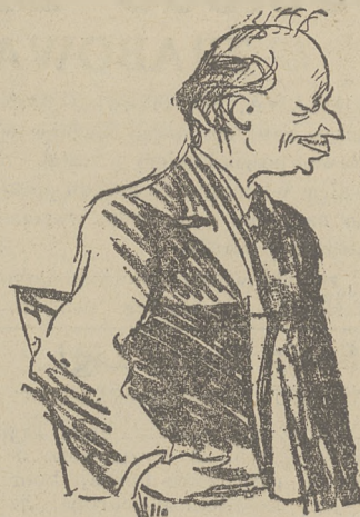
Przedstawiciel Włoch na sesji Międzynarodowego Trybunału Sprawiedliwości w Hadze Scialoja (według francuskiej karykatury), który w niezwykły ostry sposób ocenił ew. korzystny dla Niemców wyrok w sprawie „Anschlussu” jako powód wojny.