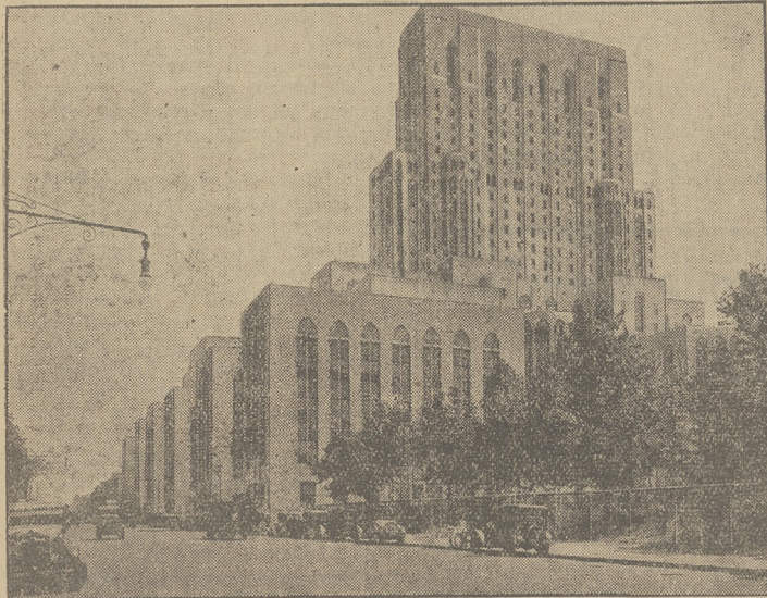
Olbrzymi kompleks szpitali, medycznych instytutów i laboratoriów, który oddano do użytku w Nowym Jarku.

Murzyni, którzy do dziś dnia faktycznie są jeszcze w Stanach Zjednoczonych obywatelami drugiego rzędu, narażonymi na ciągle szkazy i przesładowania ze strony białych, liczą obecnie naa terenie Sinoń około 12 milionów. Jeden murzyn wypadają więc na 7 — 8 białych. W stanie Mississippi stanowią murzyni nawet 60 proc. ludności. Przytem, o ile dawniej murzyni byli elementem bardzo biednym, to obecnie znaczny procent czarnych prowadzi dostatnie życie i posiada nie ruchomości. Tak więc, według amerykańskiej statystyki z 1922 roku, 650 tysięcy murzynów posiadało własne domy, a poza tem w czarnych rękach znajduje się przeszło miliona farm.