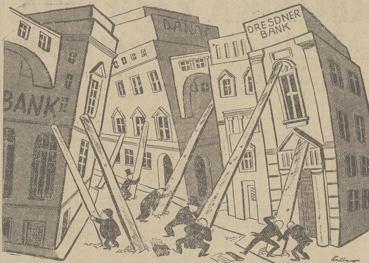
Sanacja banków niemieckich w perspektywie karykaturzysty.

Ale mimo to nie należy spodziewać się jakichś zmian zasadniczych na terenie parlamentarnym. Sejm jednak jako trybuna, z której ze względu swobodą można wykazywać błędy obecnego systemu rządzenia, posiada w tych ciężkich czasach znaczenie poważnego bądźco bądź mentora.