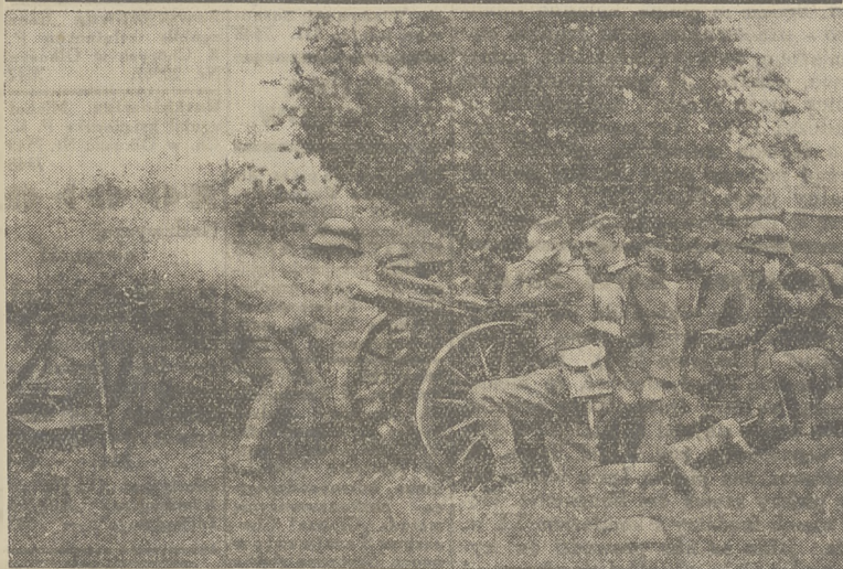
Z manewrów „rozbrojonych” Niemiec w Bawarii.

Trzęsienia ziemi powtarzać się będą w coraz częstszych odstępach czasu. Trudno przypuścić, by ten koniec świata nastąpił bardzo wcześnie, za życia naszego, naszych synów, wnuków czy prawnuków. Ale że nastąpić może bardzo szybko, to nie ulega wątpliwości. Do tego zaś czasu coraz częściej ludzkość cierpieć będzie wskutek wstrząsów podziemnych, rozdzierających skerupę ziemi. Dokładne rozwiązanie zagadnienia nastąpi w chwili zmontowania gigantycznego teleskopu, który będzie prawdziwym "okiem", pozwalającym zgłębić wielkie tajemnice wszechświata.