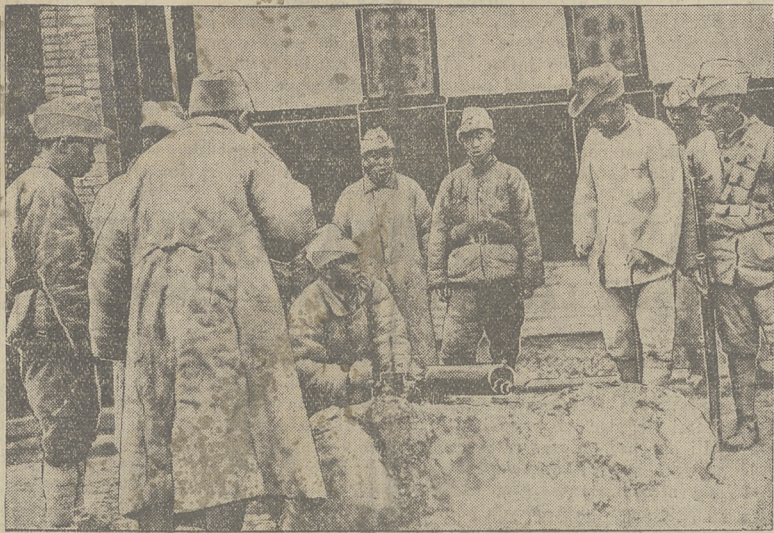
Piechota chińska na pożyczkach pod Charbinem.