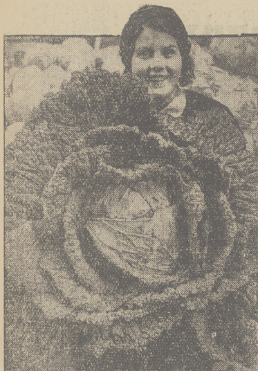
BYWAJA I TAKIE. Głowa kapusty o obwodzie 2,15 metrów.