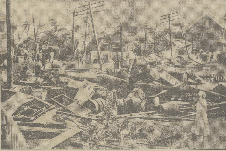
GRUZY MIASTA BELIZE (HONDURAS) po przejściu strasznego orkanu, który zniszczył miasto i spowodował śmierć 1000 mieszkańców.