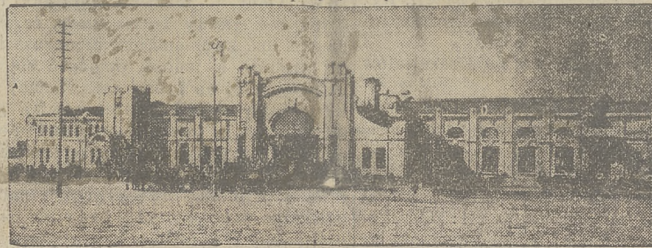
Dworzec kolejowy w Charbinie, punkt węzłowy mandżurskiej linii kolejowej.

Na pytanie, jaki jest los Japończyków w Charbinie, ministrowie zapewнили dziennikarzy, że ewakuacja obywateli