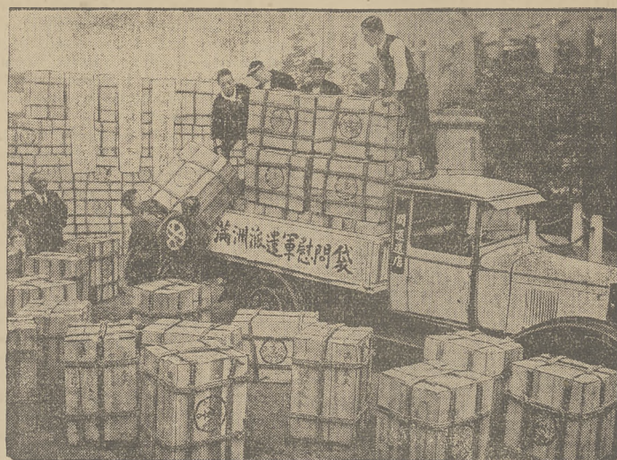
PODARKI ŻOŁNIERZY JAPONSKICH, wysyłane z Tokio do Mandżurji.