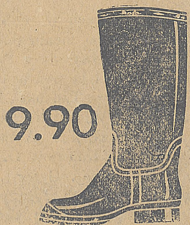
9.90 Dla dzieci. Fason 9891-50 Wellingtonki z lakierowanej gumy w kolorze czarnym lub brązowym.