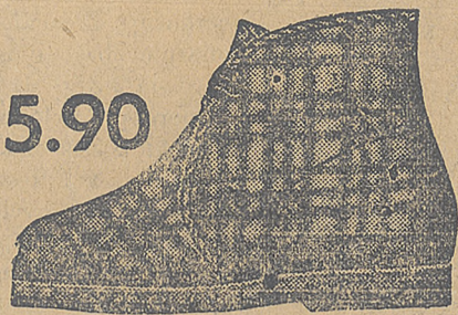
5.90 Najodpowiedniejsze obuwie dla dzie- ci w domu. Bardzo ciepłe i wygodne.