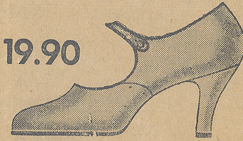
19.90 Eleganckie czarne pantofelek lakowy na wy- sokim obcasie.