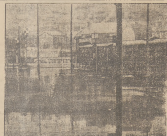
POWÓDZ WE FRANCJI. Dworzec w Poitiers pod wodą.

wiekcel czysty na 50 zł. żyrowany Ignacy Waśniewski. Ostrzeżeniem przed przyjęciem. 255