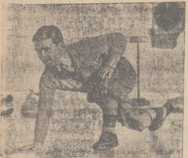
GORDON RICHARDS, najjaśniejszy dżokej angielski przebywa obecnie w St. Moritz, gdzie uprawia sporty zimowe.