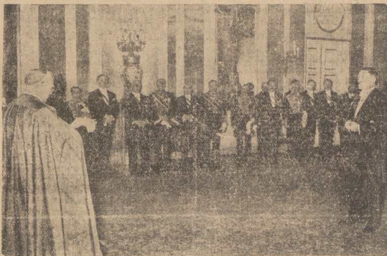
NOWOROCZNE PRZYJĘCIE U HITLERA. Nunociusz papieski Monsignore Orsenigo składa kanderlowi Hitlerowi życzenia noworoczne w imieniu korpusu dyplomatycznego. Uroczystość odbyła się dnia 10 stycznia w pałacu kanderleskich w Berlinie.

W zakończeniu stwierdzić należy, że omówione wyżej, w znacznym skrócie, jak i inne sprawy poruszane na konferencjach, wniosły wszelkie, a w znacznej mierze i obiektywne nasświetlenie oraz liczne sformułowania, co z pewnością stanowić będzie cenny materiał informacyjny i orientacyjny dla Rządu wobec tego poczynił gospodarczy.