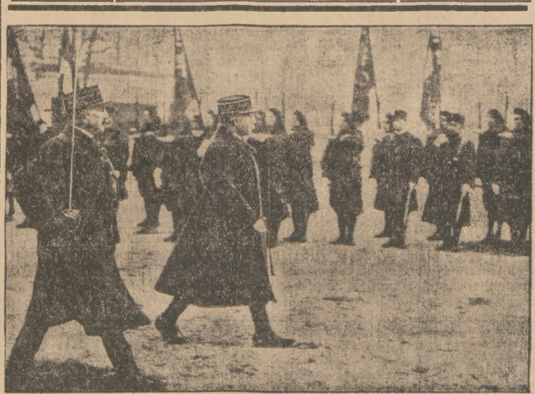
WÓDZ ARMII FRANCUSKIEJ W MARSYLII.

W tym punkcie zagadnienie naszej siły obronnej staje się częścią zagadnienia wielkiej reformy gospodarczo - finansowej państwa polskiego.