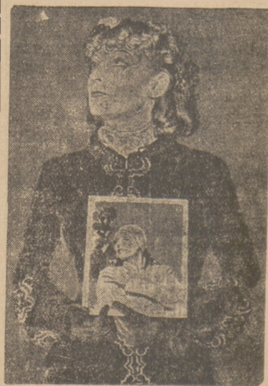
SOBOWTÓR GRETY GARBO.

Bezpośrednio po tych zajściach interwenjowała wezwana zapewne przez zarząd cukierni policja i dokonała aresztowań. Nazwisk aresztowanych nie udało się ustalić.