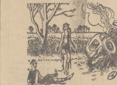
— Który był nasz samochód. Jakiu. Ja potrzebuję niezwłocznie mojego neseteru.

lipcowy świeżego zbioru pod gwarancją — prawdziwy polecają Koziolki i Jedryczki Sosnowiec. 3-go Maja Nr. 21. 4057