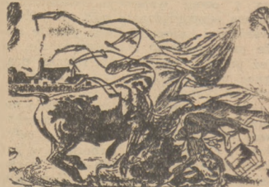
— Ja wiem, że to jest tylko sen. Jestem przecięt w piżamie.

oddano do ruchu w angielskich okręgach przemysłowych