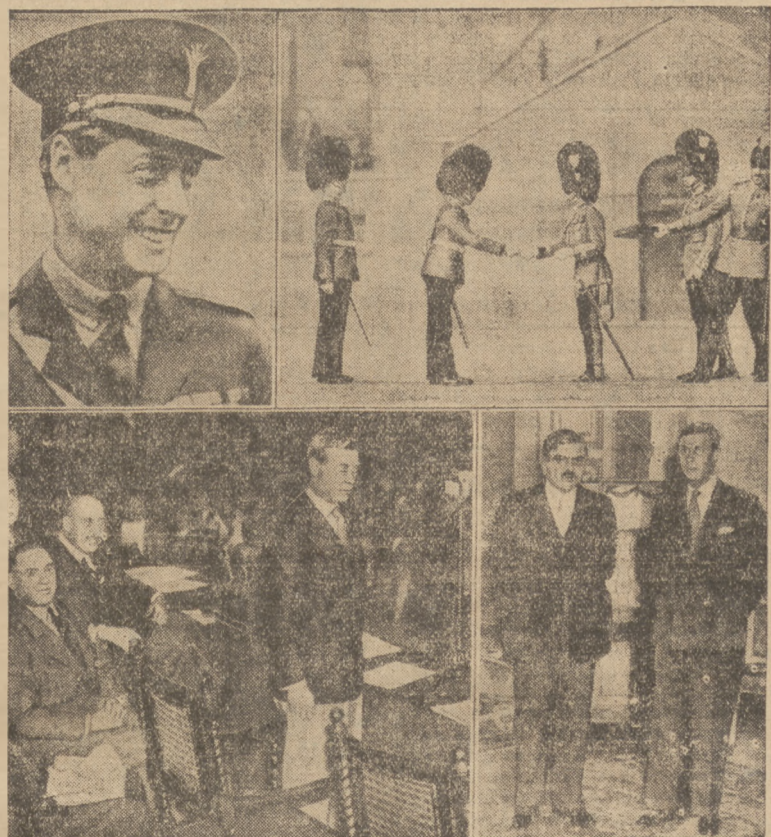
DAWNIEJ KSIĄŻE WALJI — DZIS KRÓL EDWARD VIII.

Obecny król Edward VIII, dawniej książę Walji, jest najpopularniejszą osobliwością w Anglii, przez wszystkich niezmiernie lubianą. U góry z lewej — uśmiech księcia Walji; u góry z prawej — książę Walji, w ogromnej czapce (trzeci od lewej) wita się z oficerami pułku, któremu patronuje; u dołu z lewej: książę Walji przy mikrofonie na dziedzińcu b. komendantów z wojny światowej; u dołu z prawej: przemawia z premerem francuskim Lavallem, w przededniu konfliktu włosko-abisyńskiego.