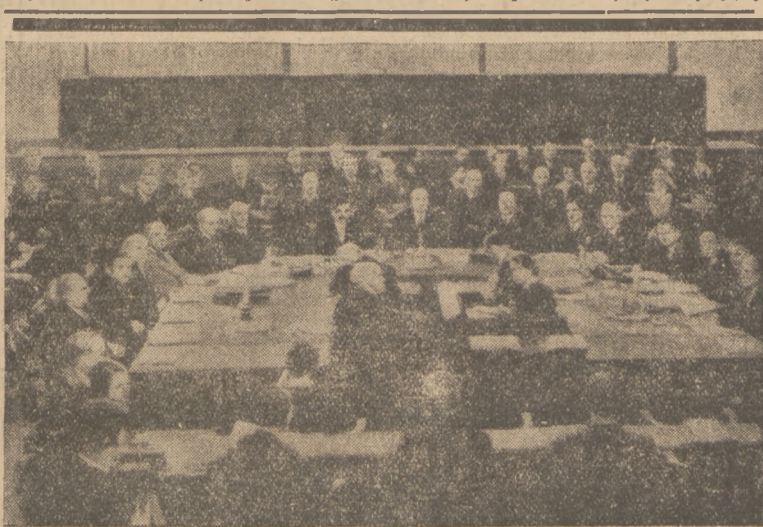
POSIEDZENIE LIGI NARODÓW.

chętnie, rozmawiają z sobą pocichu: nie słychać nawet trąbek samochodowych.