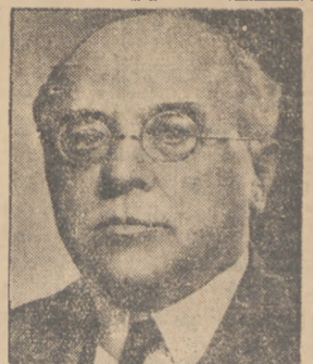
SEN. ALBERT SARRAUT, nowy szef rządu francuskiego.

NOWY JORK, 25.1. (Tel.wł.). W późnych stanach utrzymują się nadal niezwykle silne mrozy. W ciągu ostatnich 3 dni na teren 16 stanów zamarzło na śmierć 129 ludzi. Ze stanów Minnesota, północna Dakota, Illinois i Iowa donoszą o dalszym spadku temperatury, która wynosi od 25 do 29 stopni celcjusza. Mrozy sprzyjają również szerzeniu się pożarów, których zwalczanie jest w tych okolicznościach nie zwykle trudne. W północnej części stanu Nowojorskiego spaliły się w piątek 3 wieś.