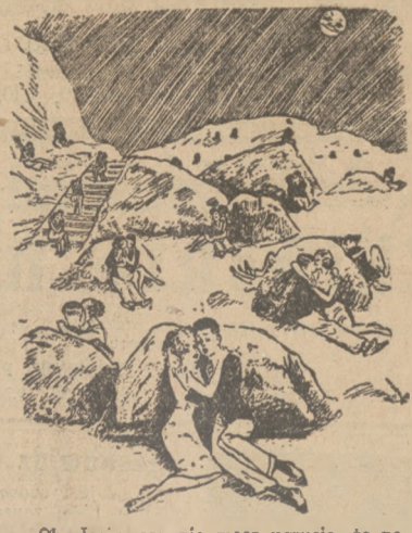
— Oh, Jesiu, czy nie masz uczucia, że na całym świecie niema takiej miłości, jak nasza? —

Słynny jasnovidz Osowicki z Warszawy przewidział główną wygraną loterii premijowej za pomocą klucza wibracyjnego, gdzie kupic szczęśliwy los. Wyświetla najbardziej zakładowe sprawy miłośna, handlowe, spadkowe. Ostrzeżenie przed pseudo-jasnovidzami, którzy szumnie się ogłaszają i wykorzystują Publiczność nie mając żadnego daru Bożego. Tylko przez krótki czas oferuje dla dobra ogółu. każdemu horoskop przyszłości do 39 roku kalendarzowego tylko za 5.- zł natomiast bez horoskopu 1.50 zł. śniaczkami, bez żadnych dopłat. Przyjmię datę urodzenia i imię matki. -9517 Kraków, ul. Św. Tomassa 15 m. 2.