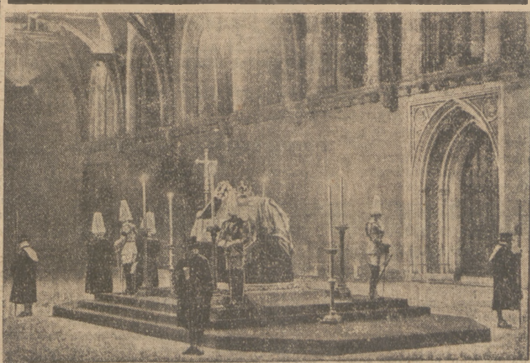
W KATEDRZE WESTMINSTERSKIEJ. Wystawienie zwłok króla Jerzego. Na trumnie spoczywa korona Imperjum.

dzie 142 marynarzy pod komendą 5 oficerów. Orszakowi towarzyszyć będzie batalion czarnej gwardji szkockiej. Orszak poprzedzać będzie 16 „piperów” gwardji szkockiej, którzy na swych narodowych instrumentach grać będą szkockie melodie żałobne.