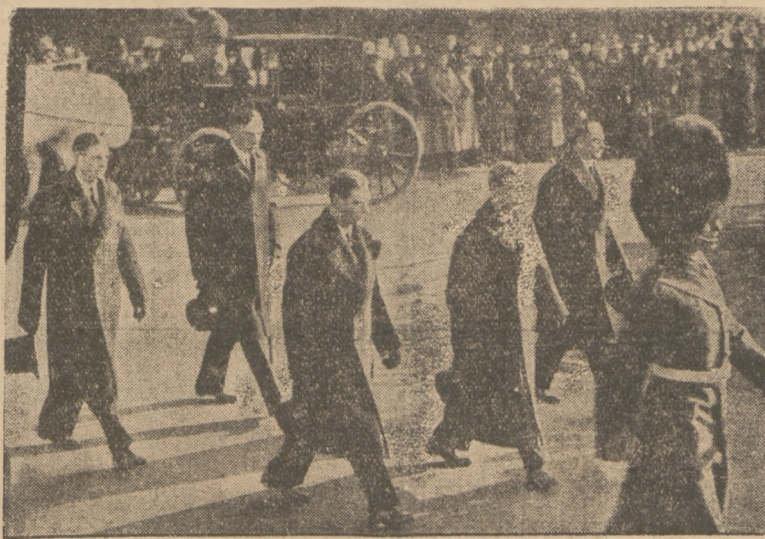
ZA TRUMNĄ Z SZCZĄTKAMI KRÓLA JERZEGO.

uchwalone na ostatnim posiedzeniu Sejmu.