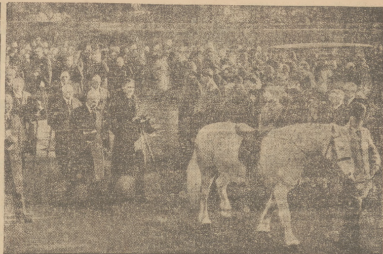
KOŃ KRÓLA JERZEGO w pochodzie żałobnym do katedry westminsterskiej.