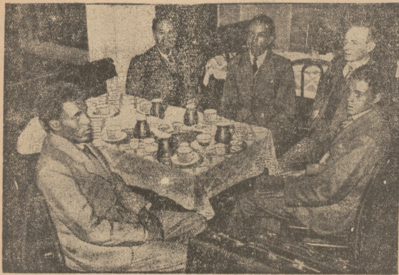
ABISYŃCZYCY STUDJUJĄ W EUROPIE.

Do Hamburga przybyło czterech młodych Abisyczyków, którzy będą studiować w Niemczech. Ukończyli oni królewskie liceum w Addis Abebie.